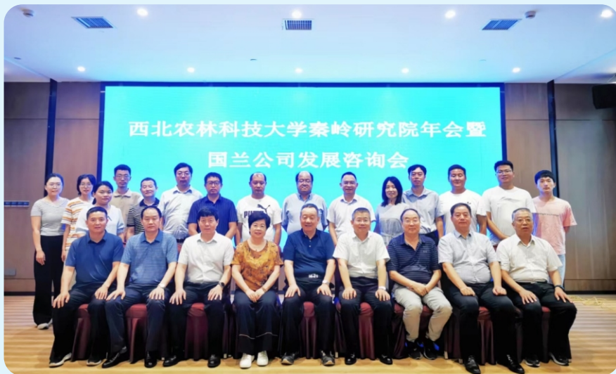
8月8日，秦岭研究院年会暨国兰公司发展咨询会在石泉召开