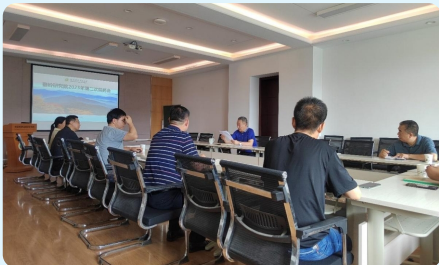
7月12日，秦岭研究院第二次院务会通报工程技术中心专家组成员 变更并筹划秦岭研究院年会暨国兰公司发展咨询会