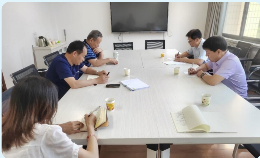
7月9日，秦巴山脉珍稀植物繁育保护研究工程技术中心 向秦岭研究院汇报兰花产业发展