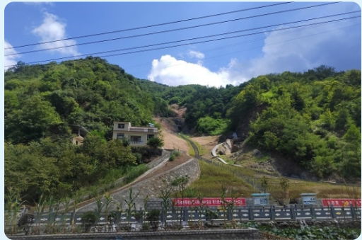
8月4-9日，水资源研究中心在丹凤县、商南县、丹江口水库、白河县、旬阳县、安康市汉滨区、汉阴县开展“秦岭水资源保护和水土保持高质量发展对策”调研活动