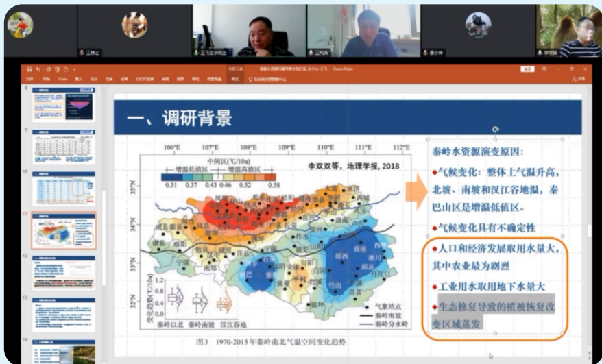
6月9日，秦岭研究院专项项目线上评审