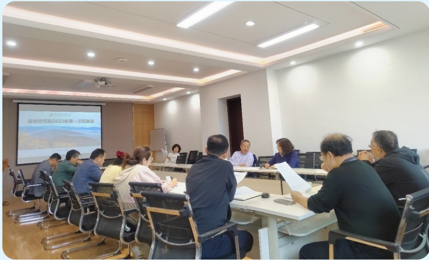
5月23日，秦岭研究院第一次院务会讨论秦岭研究院专项项目申报指南并筹划秦岭水资源考察