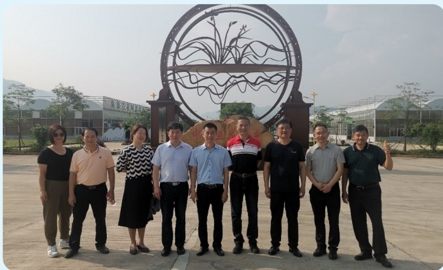
5月18-20日，秦巴山脉珍稀植物繁育保护研究工程技术中心 在“中国兰花之乡”广东翁源县考察