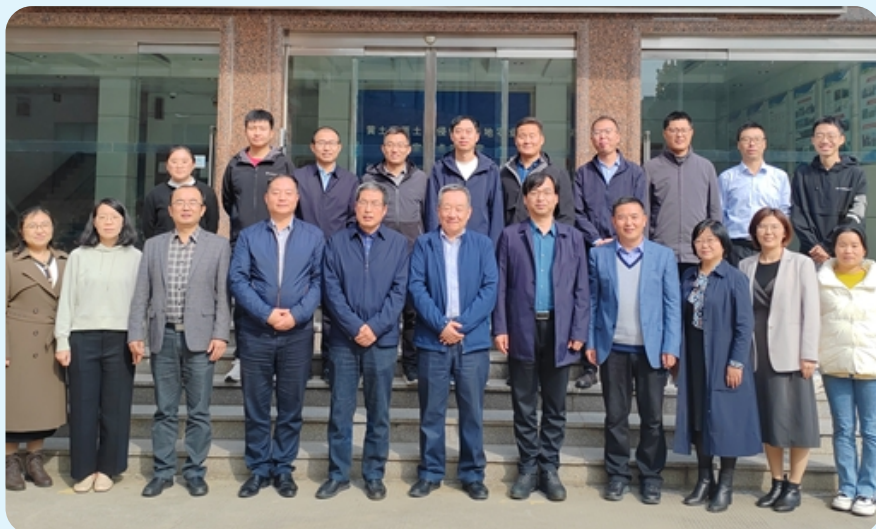
10月23-24日，秦岭水土保持与水源涵养治理需求与目标研讨会在西北农林科技大学水土保持科学与工程学院黄土高原国家重点实验室会议室召开