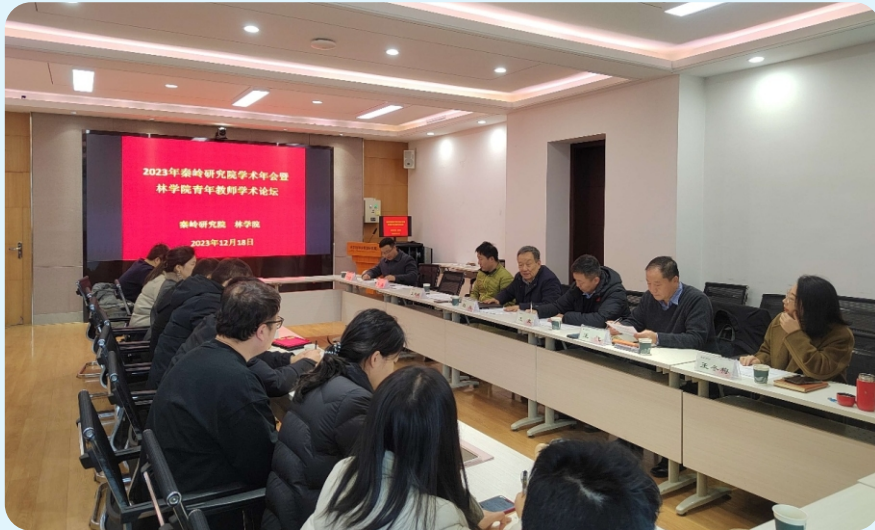
12月18日，秦岭研究院学术年会暨 林学院青年教师学术论坛在林学院召开