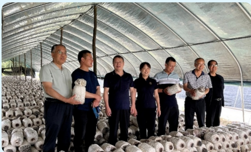
6月，食用菌中心在淳化县和太白县开展食用菌产业发展调研